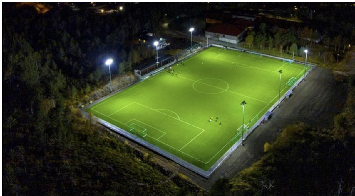
OMSUNDET KUNSTGRESSBANE: Nytt kunstgressdekke sommeren 2022

Kristiansund Ballklubb spilte tidligere hjemmekampene sine her, og satte tilskuerrekord med 3000 tilskuere i hjemmeseieren over Rosenborg i cupens 2. runde i 2008.