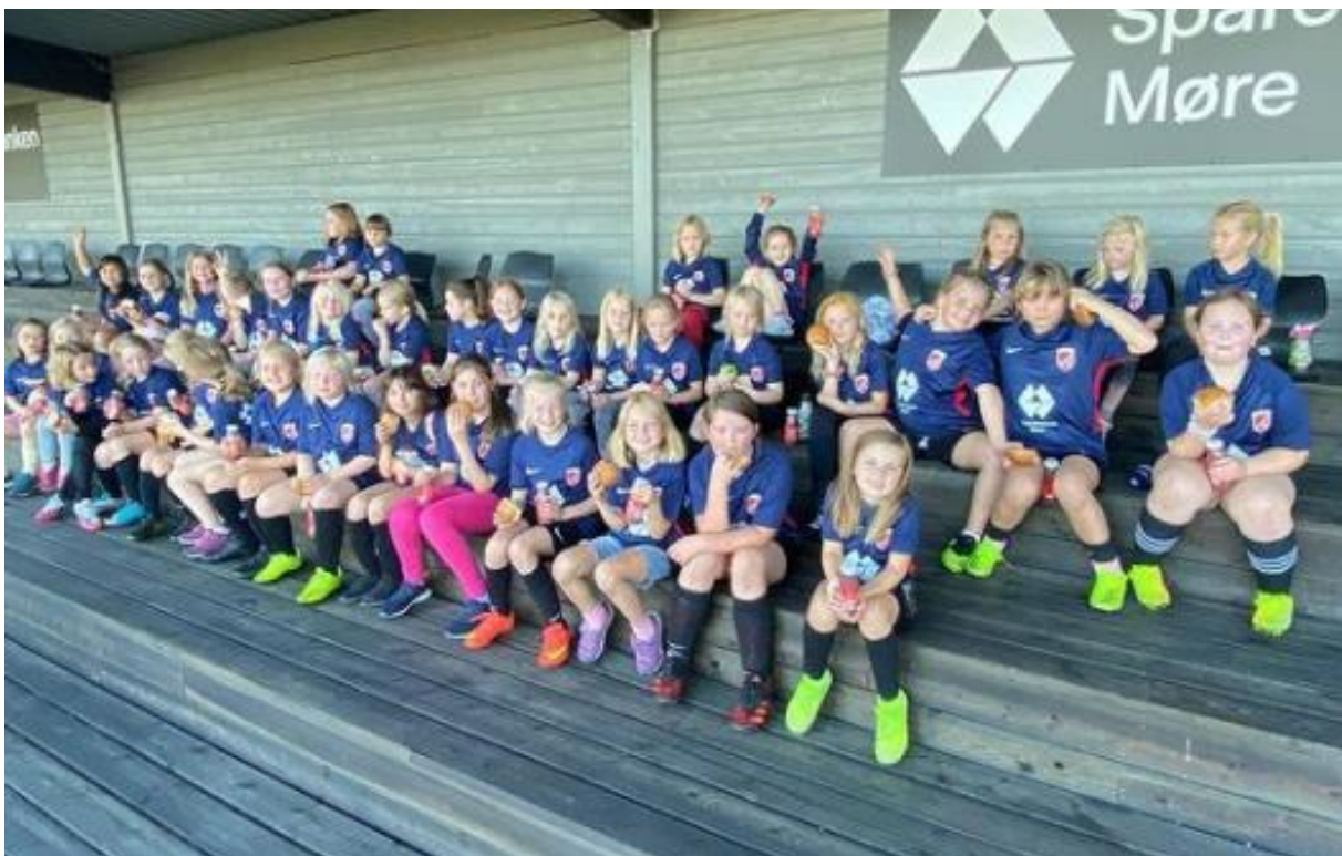
ALLE JENTER PÅ BANEN: Klubben fortsetter suksessen!

Tilskuddsbeløp er fastsatt til kr. 5000,- pr. deltakende lag. Tilskudd gis bare en gang pr. år pr. lag. Dette må søkes styret om i god tid før deltakelse. Det forutsettes at lag som søker støtte består av spillere som har betalt medlemskontingenten for inneværende år.