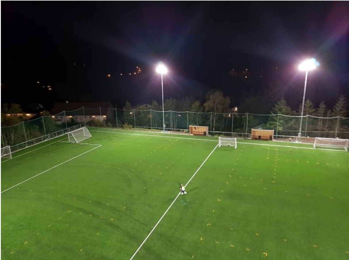
RENSVIK KUNSTGRESSBANE: Gode gamle Rensvikbanen ble opprustet med kunstgress i 2017.

Rensvik Kunstgressbane ble etablert og stod ferdig i mai 2017 som en fullverdig 9'er kunstgressbane etter en fenomenal dugnadsinnsats. Dette var helt nødvendig, da banekapasiteten i klubben de siste årene ikke har vært god nok. Rensvik Kunstgressbane er i dag i full bruk og benyttes både til trening og kamp for lagene i Frei FK.