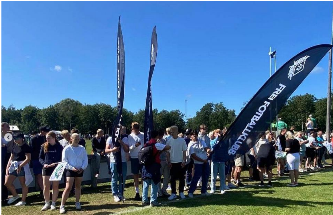
FREI FK: En synlig klubb med hjerte!

Bekledning av trenere/lagledere vil bekostes av klubben. Når og hvor mye bestemmes av styret. For øvrig skal alle store innkjøp tas opp og godkjennes med styret før bestilling.