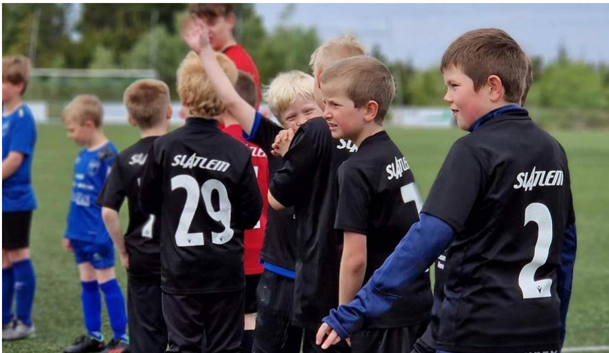
BORTEKAMP: Spenningen stiger i påvente av kampstart.

Det finnes fire fotballederkurs. Fotballeder 1 – forstå, Fotballeder 2 – lede, Fotballeder 3 – utvikle og Fotballeder 4 – klubbleder. Frei Fotballklubb ønsker at flest mulig med sentrale verv i klubben tar en eller flere lederkurs. Vi har som mål at over halvparten av styret skal ha ett eller flere lederkurs.