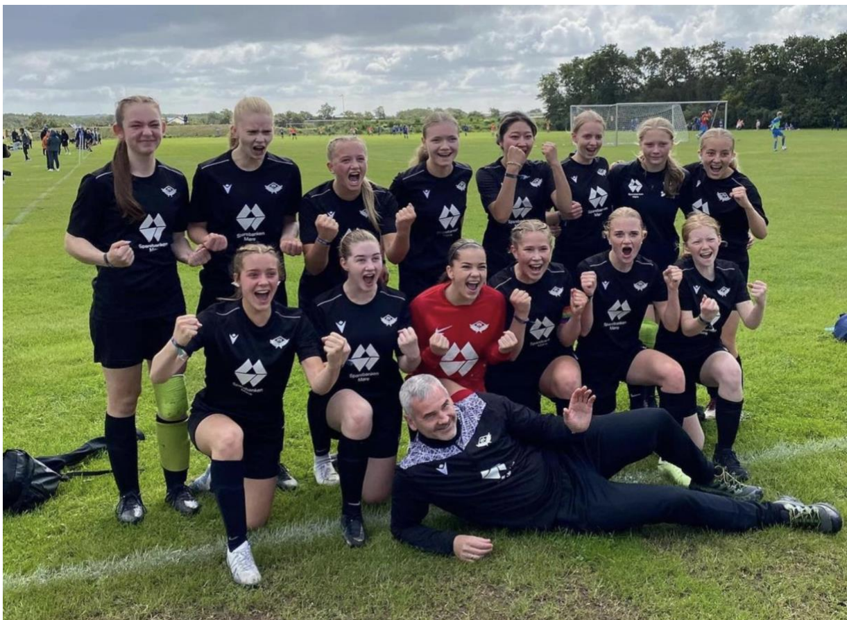
DANA CUP 2023: Frei FK J15 tok bronse i a-sluttspillet i den gjeve turneringen i Danmark.

Frivillighet: Klubben er basert på en frivillighet der dugnad og frivillige oppgaver skal komme klubben til gode.