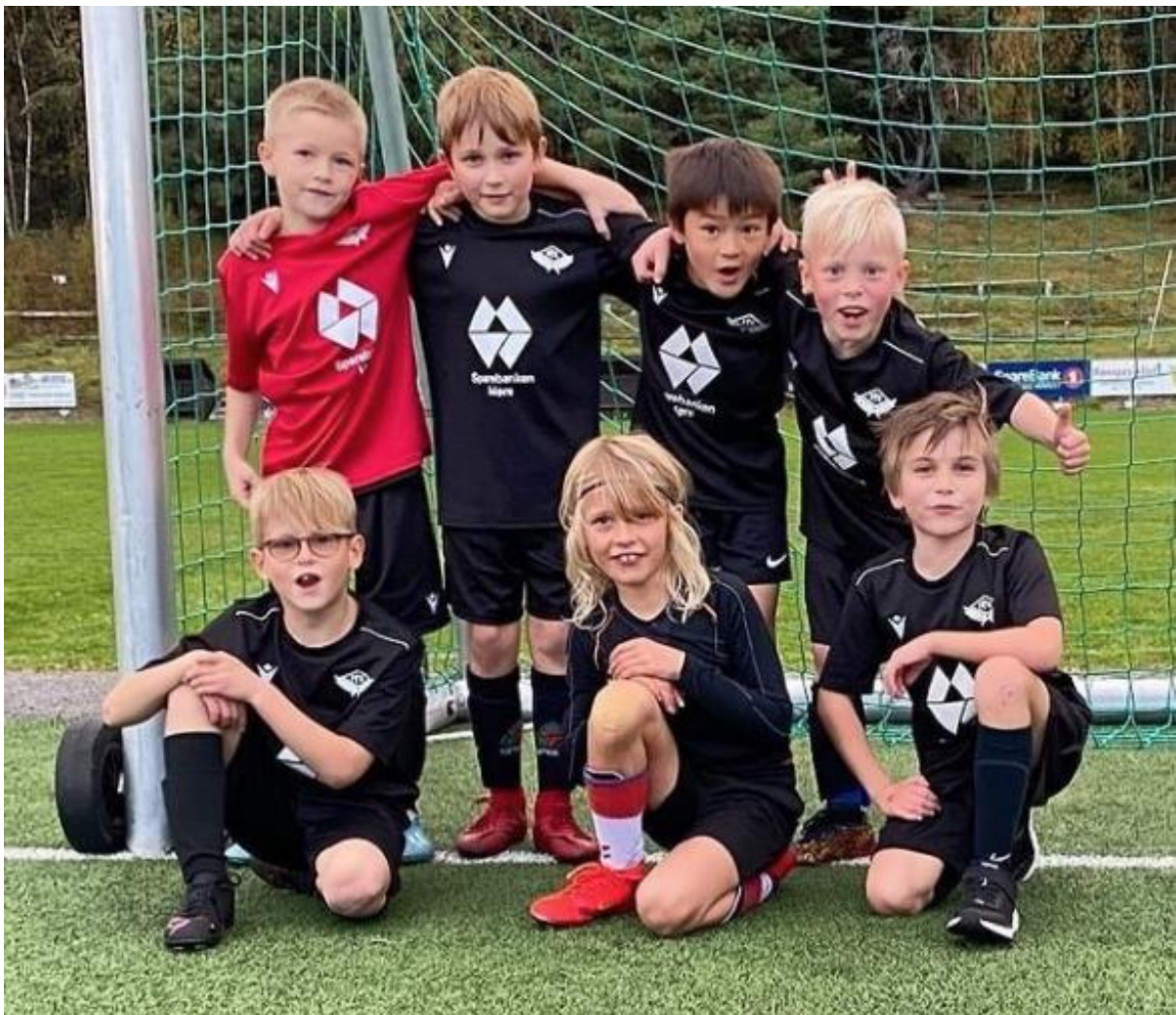
FREI FK G9

Klubbhåndbok og sportsplan skal, på initiativ fra sportslig utvalg, revideres to ganger hvert år. Dette i løpet av månedene mars og oktober. Sportslig leder er ansvarlig for at dette blir gjennomført.