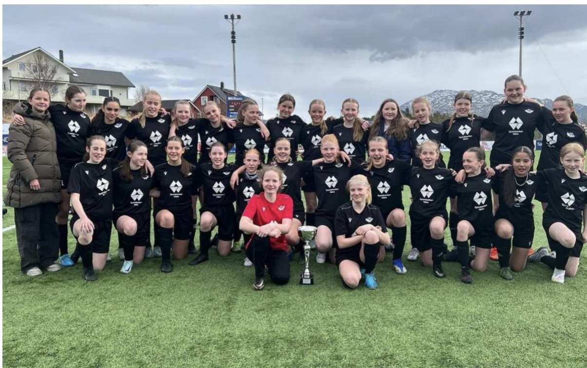
ÅPNINGSCUPEN: Frei FK J14 vant åpningscupen i 2023!

Dette arrangementet skal markere årets seriestart for lagene og åpen dag skal være en årlig aktivitet som barna gleder seg til. Eksempel på aktivitet kan være merkeprøver.