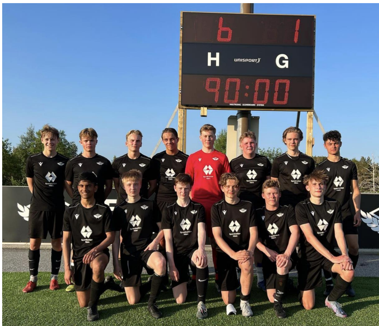
FREI FK G19: Juniorlaget poserer foran resultattavla etter en imponerende seier mot Molde FK.

Frei Fotballklubb sine vedtekter finner du som vedlegg til slutt i dette dokumentet. I tillegg er de tilgjengelig på klubbens hjemmeside.